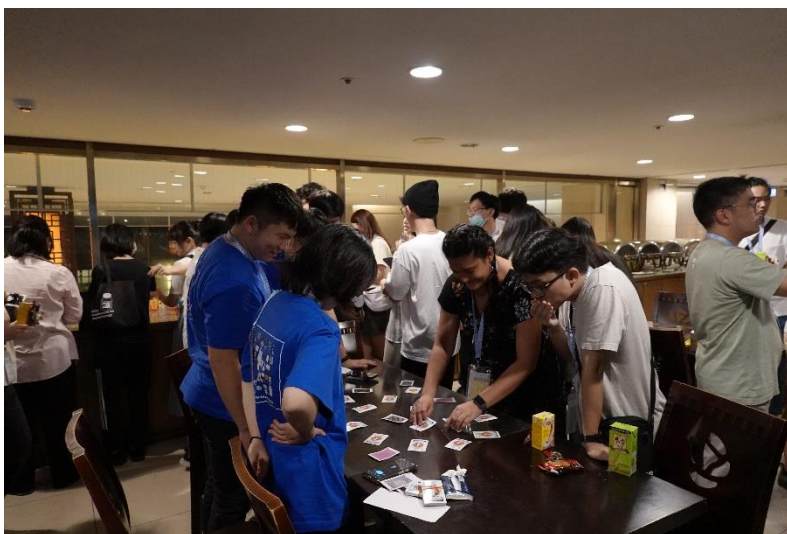
▲圖八、研討會期間有許多交流機會，透過遊戲和活動認識來自不同單位及領域的新朋友，促進細菌學研究者之間的緊密連結。