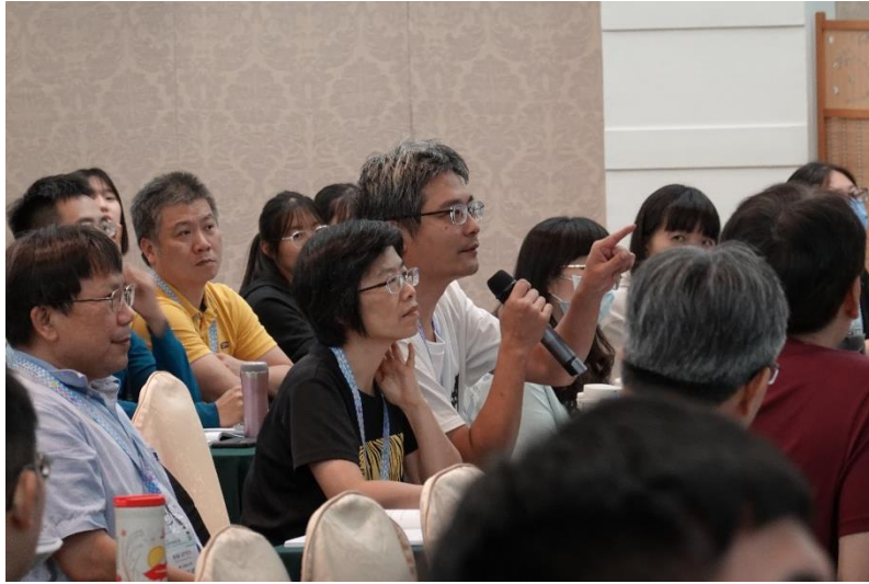
▲圖三、演講後的提問環節能與講者直接互動討論，教學相長，甚至碰撞出新的想法與合作機會，達到學術交流的目的。