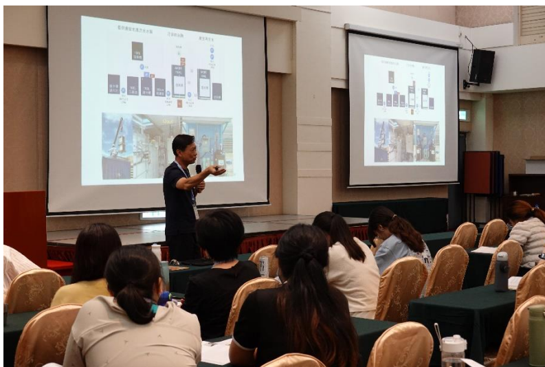
▲圖二、25 位不同領域的細菌學學者發表最新研究成果，講者生動的故事十分引人入勝，來賓仔細聆聽，生怕錯過任何細節。