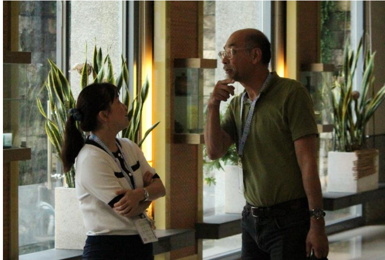
▲圖六、一年一度的研討會是許多老師難得的見面機會。在學術基礎上建立友誼，進而促成長遠的合作關係，也是細菌學研討會難能可貴之處。