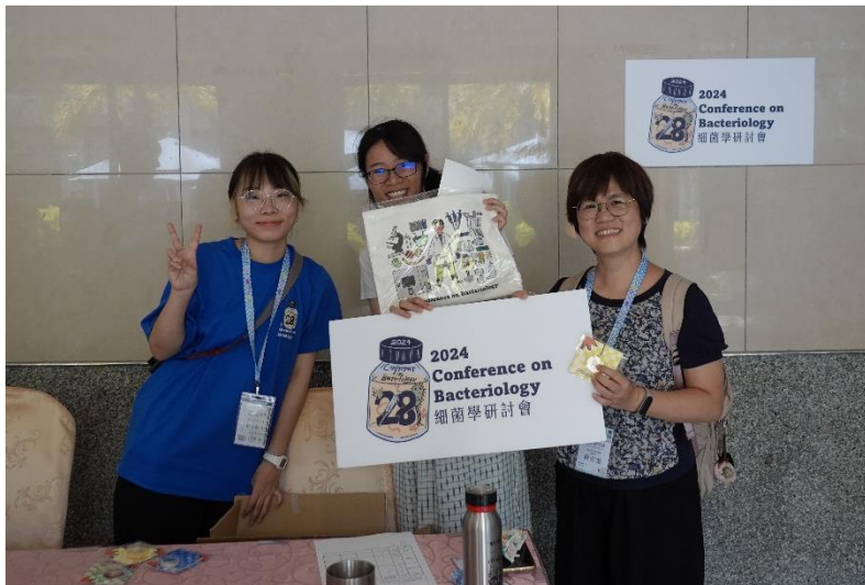
▲圖七、本次特別設計了尋寶解謎遊戲，是和細菌學相關的題目與獎品，讓大家在遊戲中學習，同時留下美好的回憶。