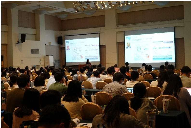
▲圖一、本次研討會共計 290 位來賓參加，座無虛席，與會者於宴會大廳內享受七個主題的細菌學盛宴。