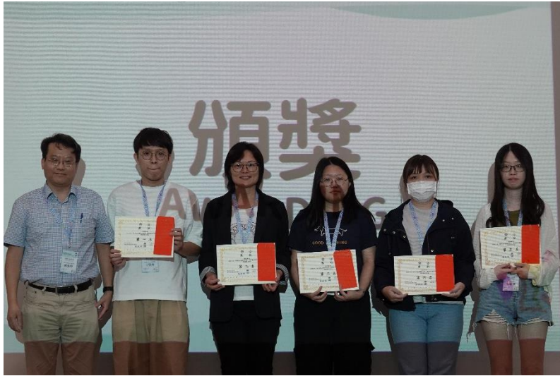
▲圖九、壁報論文發表經評選後頒發獎狀與獎學金並予以表揚，鼓勵更多年輕學者投身細菌學相關研究。