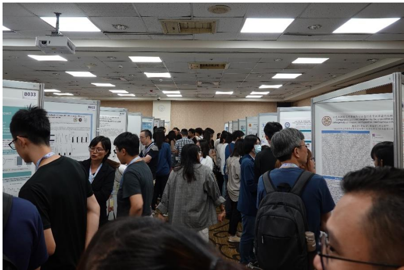
▲圖五、共收到來自各領域的 108 件海報投稿，盛況空前，展演期間內大家熱烈討論。